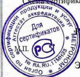
Схема сертификации – 1с